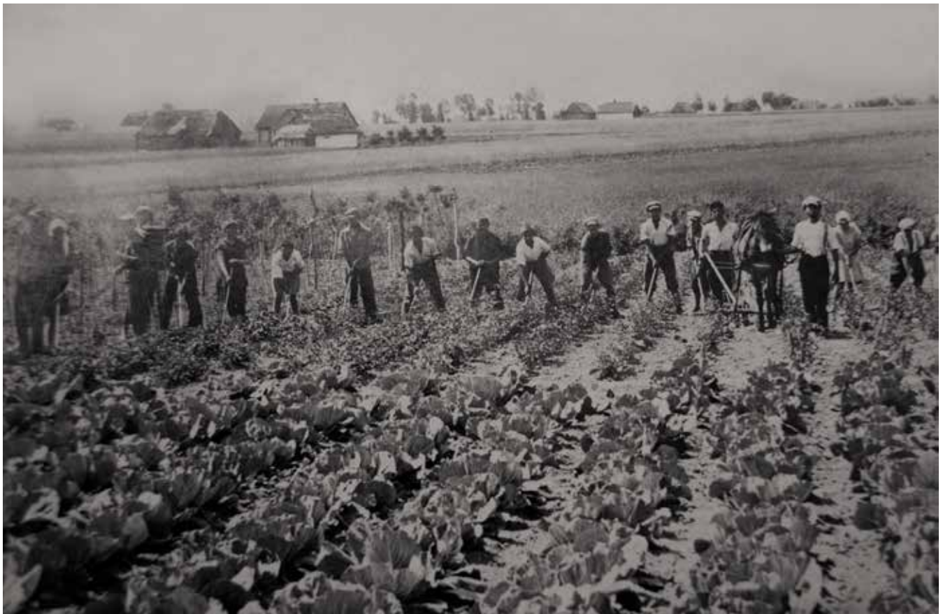
Ryc. 5. Prace polowe, Adamowice, 5 maja 1930 r. (fotograf nieznan, z archiwum rodziny Eizyków)