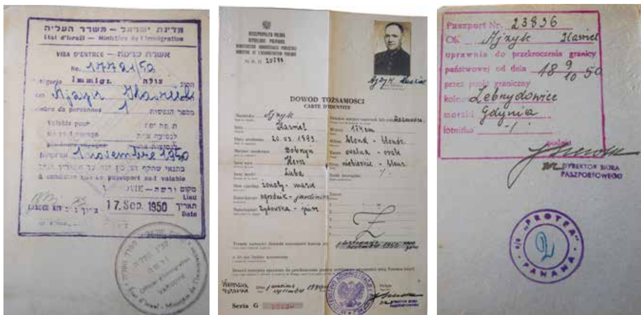
Ryc. 32–34. Emigracyjne i imigracyjne dokumenty Katriela Eizyka (z archiwum rodziny Eizyków) Fig. 32–34. Katriel Eizyk's emigration and immigration documents (the Eizyk family archive)

ocaleńców-imigrantów, i zamontowano w jego ładowniach koje dla tysiąca osób. „Protea” pływała pod panamską banderą i była zapewne najpodlej wyposażonym transportowcem, jaki pracował na europejskich wodach („USAT Cantigny – Navsource, Army Photo Ship Archive”). Niedługo po przyjeździe do Izraela lub tuż przed wyjazdem (oceniaamy to wedle wyglądu synka) zrobili sobie u fotografa wspólne zdjęcie (ryc. 35).