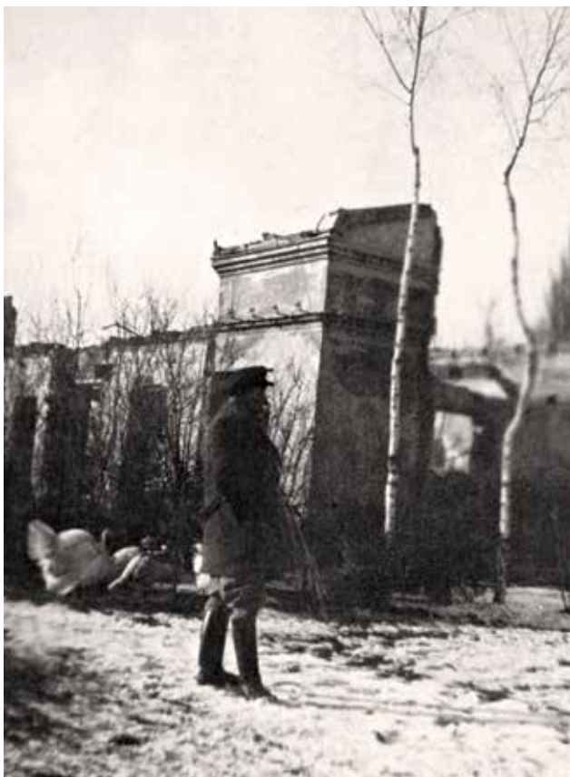
Ryc. 25. Aron przed ruinami domu Eizyków, wśród indyków

Fig. 24. Katriel and Antonina in Ciechocinek, c. 1950