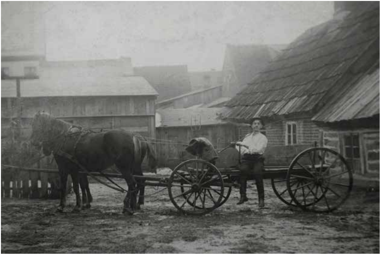
Ryc. 1. Katriel Eizyk w Dobrzyniu, 12 lutego 1912 r.; w tle po lewej zapewne młyn Hersza Eizyka