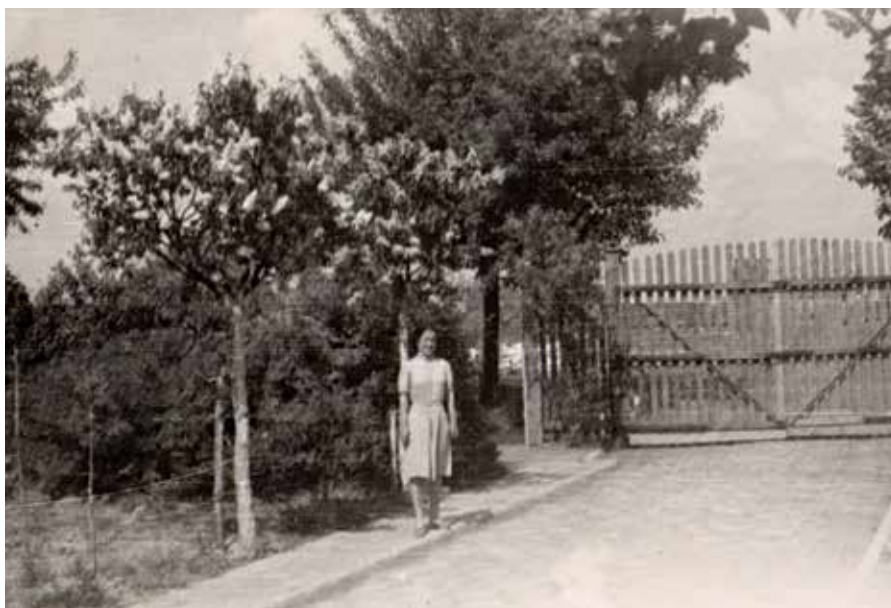
Ryc. 23. Antonina Eizyk przy bramie wejściowej, Adamowice

Fig. 22. Antonina and Katriel, just as they arrived to Poland after WW2