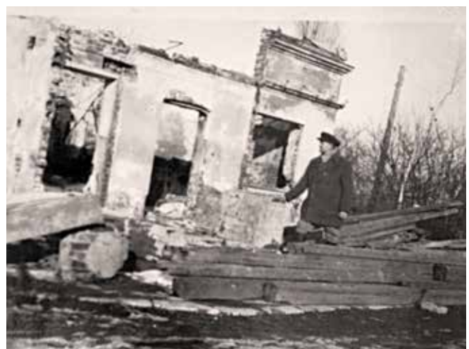
Ryc. 26. Aron przed zniszczonym domem Eizyków, niedługo po II wojnie

Jak pisaliśmy przed rokiem, zabudowania w gospodarstwie Eizyków w Kutnie były całkowicie zniszczone, a pola zdewastowane (ryc. 25, 26). Odbudowa gospodarstwa była niełatwa, powolna i objęła teren nieporównanie mniejszy niż zakład przedwojenny; całość przypominała obrazy z wczesnych lat dwudziestych XX w. (patrz: Dolatowski & Buchholz, 2018, ryc. 9), gdy Katriel dopiero zaczynał tu gospodarować „na surowym korzeniu” (ryc. 27, 28).